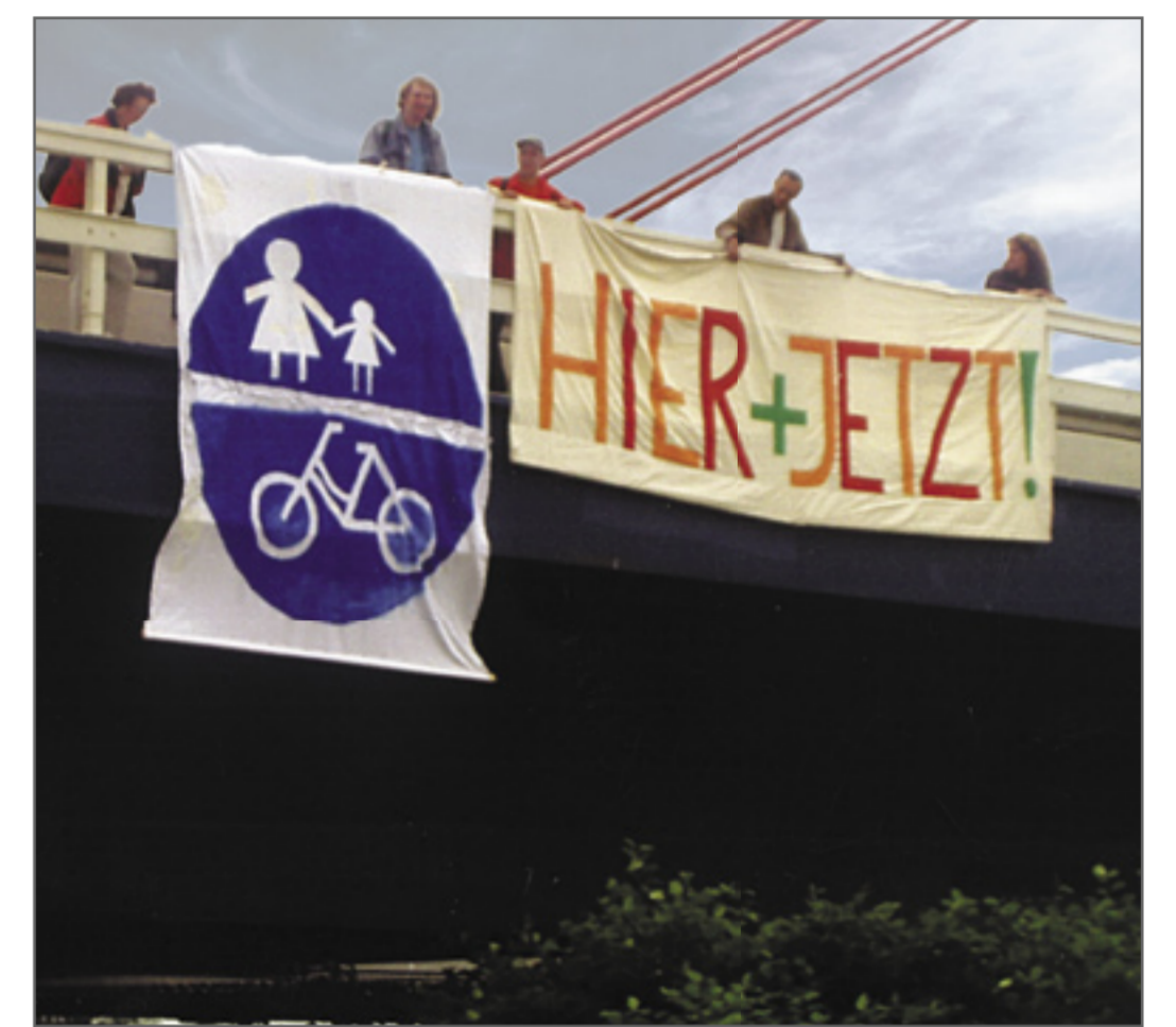
Abb. 3: Aktion für einen Rad- und Fußweg an der A1 über die Nordrelbe. Gemeinsam mit der AG Verkehr 21 und dem Verein „Zukunft Elbinsel Wilhelmsburg“