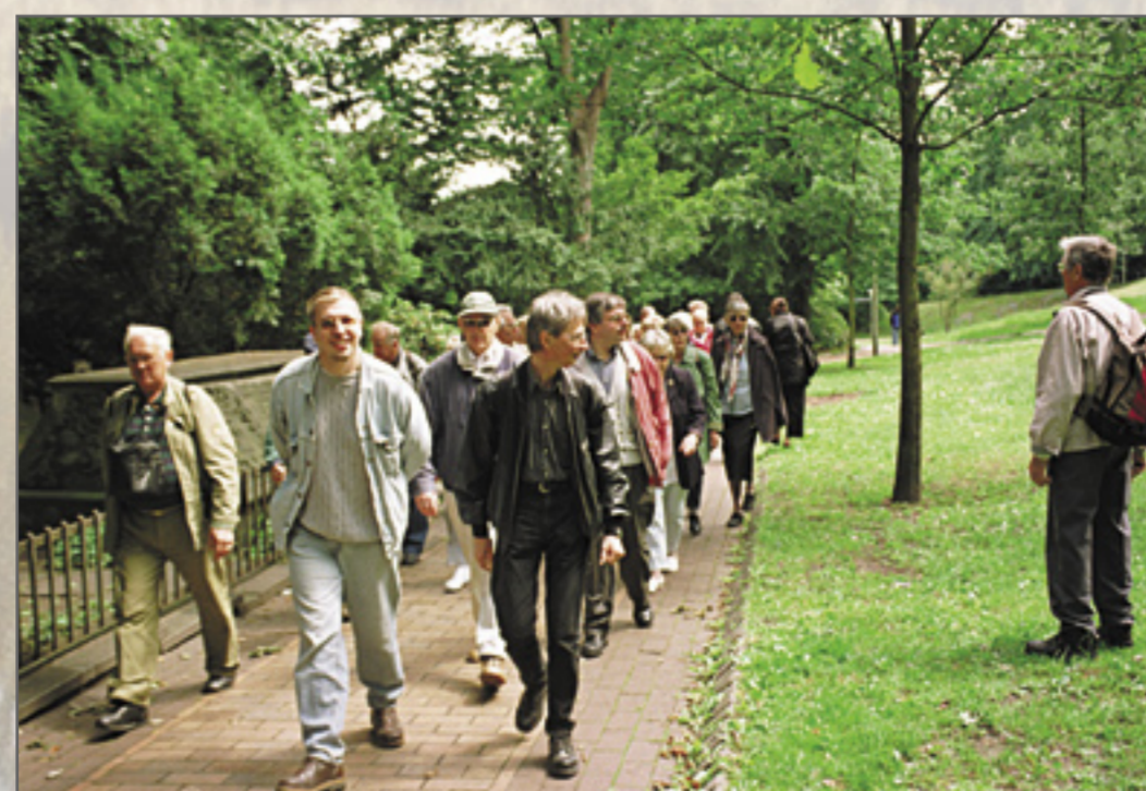
Abb. 2: Wanderung auf dem Weg „Wo die Industrie das Grün trifft“