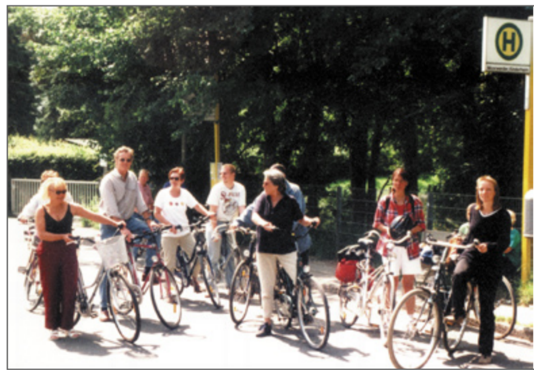
Abb. 1: Radtour durch Wilhelmsburg nach Moorwerder

Dafür steht u.a. die Arbeitsgruppe Verkehr 21 in Harburg. Sie ist 1998 gegründet worden und gehört zu HARBURG21 als Teil der lokalen Agenda 21 im Bezirk Harburg. Sie tagt in der Regel einmal im Monat und diskutiert dabei über alle Aspek-