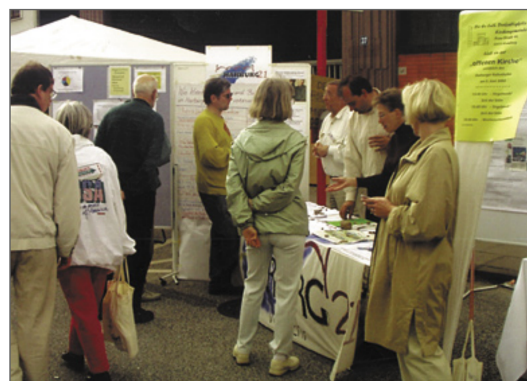
Abb. 4: Infostand auf dem Harburger Hafenfest