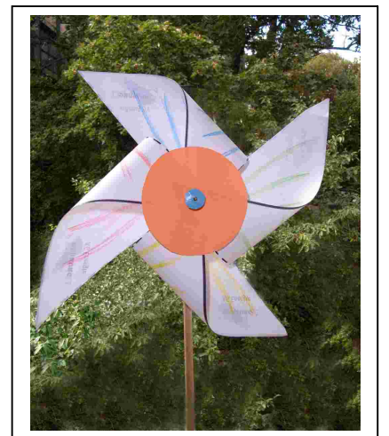
So könnte Eure Windrose aussehen