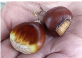
v.l.n.r.: Ess- und Rosskastanie