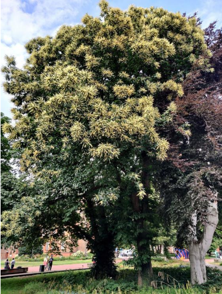
Esskastanie (mittig) neben Blut-Buche

Standort: Max-Schmeling-Park. Pflanzjahr: 1903. Siehe auch Stadtkarte hinten.