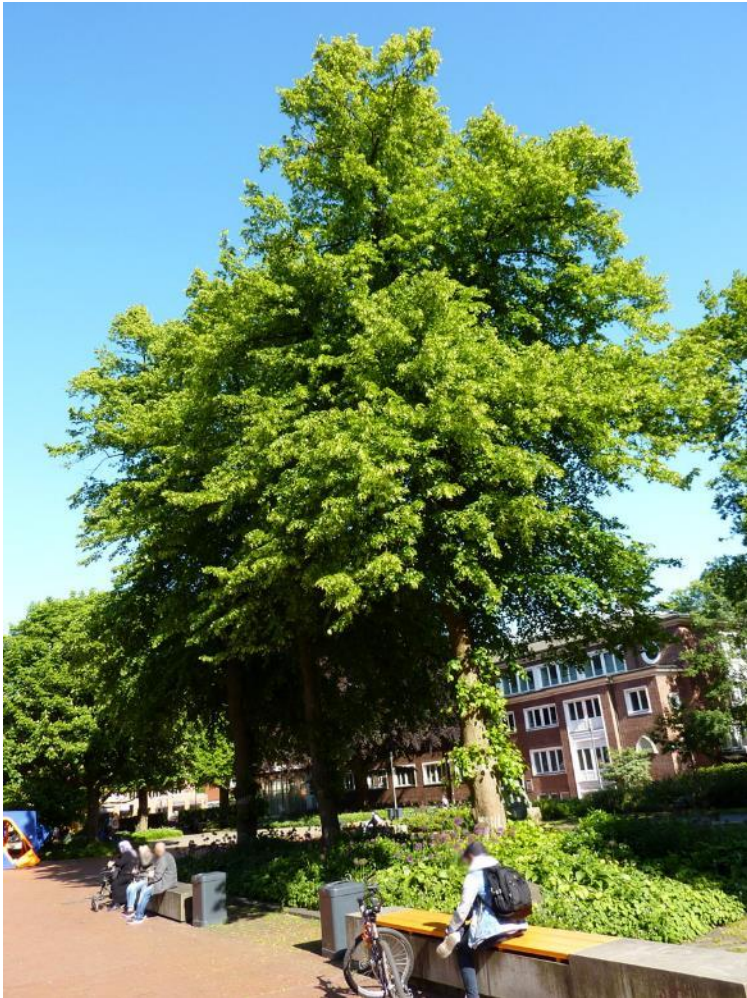
Drei Holländische Linden

Pflanzjahr: 1920. Siehe auch Stadtkarte hinten.