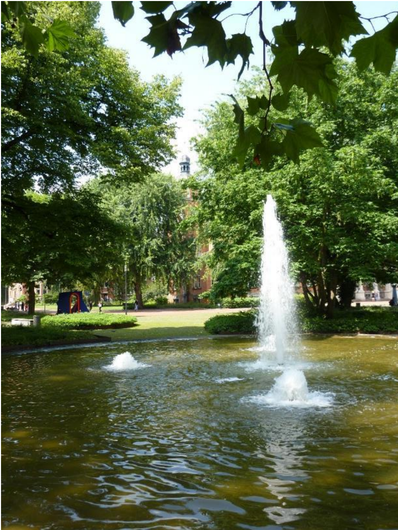
Springbrunnen auf dem Harburger Rathausplatz