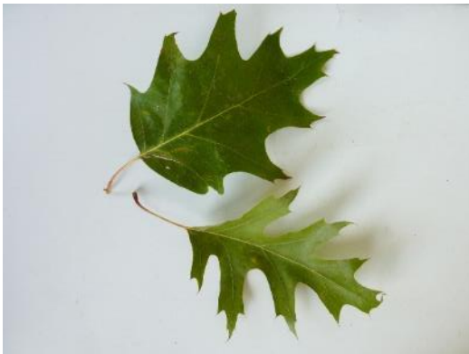
Oben: Blatt der Roteiche. Unten: Blatt der Sumpfeiche. Siehe auch Eintrag Sumpfeiche.